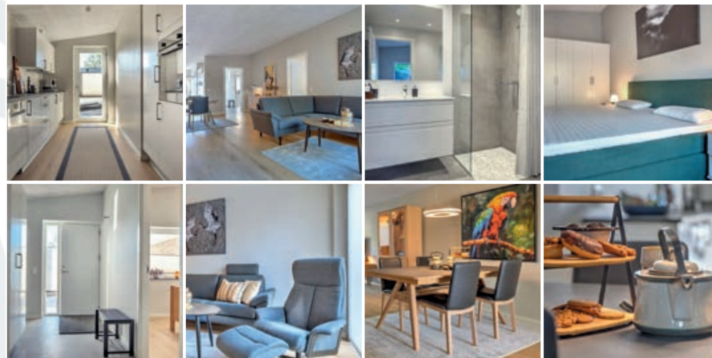
Ovenstående billeder er fra vores rækkehuse på Langrode 30–94 i Aabenraa, som er opført i 2025. Alle vores boliger opføres med samme kvalitetsniveau – forskellen ligger typisk kun i størrelsen.