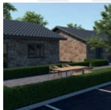
Visualisering af Tinggård

Hver bolig har en stor, flisebelagt terrasse – syd- eller vestvendt – på mellem 31 m 2 og helt op til 43 m 2 , hvor solen kan nydes dagen igennem. Derudover har alle boliger en mindre terrasse ved indgangen på 6–24 m 2 . En del af terrassen på begge sider af huset er overdækket, hvilket giver mulighed for at sidde ude i både sol og let regn og det skaber et hyggeligt og indbydende ankomstområde med ekstra læ og komfort.